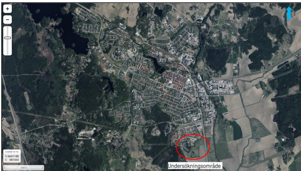
Figur 1. Översiktsbild över undersökningsområdet, markerad med röd cirkel 1 .

Syftet med markmiljöundersökningen var att översiktligt undersöka föroreningsituationen i mark inom aktuellt undersökningsområde inför kommande schakt- och anläggningsarbeten.