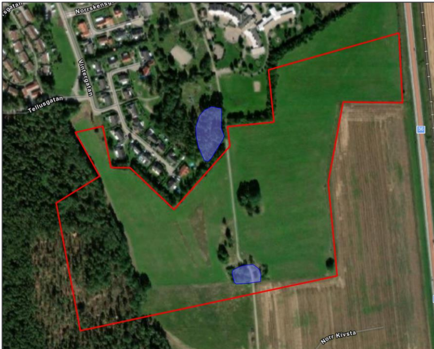
Figur 2. Fornlämningar (blå markering) vid till undersökningsområdet (röd markering). 4

Längs med undersökningsområdet ligger två fornlämningar bestående av fossilåker av röjningsröseområde och bebyggelselämning raserade grundrester 3 . En av dessa fornlämningar ligger i direkt anslutning till undersökningsområdets norra sida och den andra ligger i södra delen av området (Figur 2).